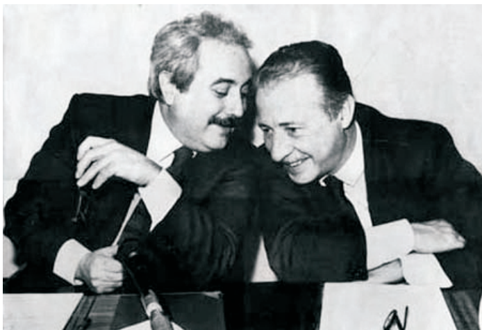
La loro lezione di libertà e democrazia

Il 23 maggio 2007 ricorre il XV anniversario della strage di Capaci. Sono trascorsi quindici anni da quel tragico 1992 e, anche quest'anno, vogliamo ricordare il sacrificio dei due magistrati attraverso i volti e le parole di quanti si sono da sempre contraddistinti nella lotta all'illegalità, alla criminalità e alla mafia e di quanti, ogni giorno, si impegnano per promuovere una cultura di legalità e di non-violenza nella nostra società.